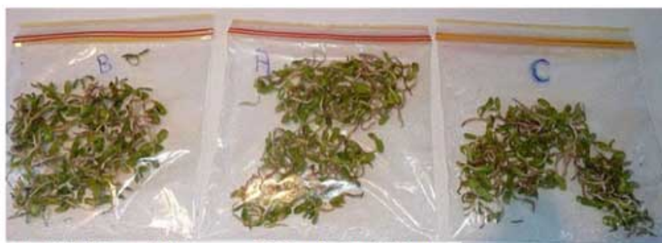
Final Yield after sunlight exposure B: 32gm A: 39gm C: 30gm water was just gravity fed- lo pressure, group A- Imploder Circulated 6 x group B- once, group C - control untreated water Thanks! to Chris Dean- in Australia..